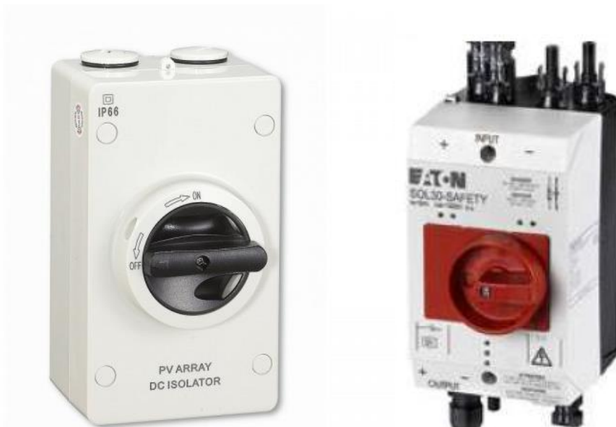
Figur 2. Exempel på säkerhetsbrytare

Ur räddningstjänstsynpunkt måste en solcellsanläggning kunna frånkopplas så nära solcellerna som möjligt för att säkerställa säkerheten för räddningstjänstens personal vid en räddningsinsats. Det är lämpligt att installera en säkerhetsbrytare, ibland kallad brandmansbrytare, så nära solcellspanelerna som möjligt. När säkerhetsbrytaren bryts, i kombination med att fastighetens koppling till det vanliga elnätet har brutits, ska det inte finnas några strömförande delar i fastigheten utöver solcellspanelerna i sig. Säkerhetsbrytaren ska vara manuell och får inte automatiskt återgå till sitt ursprungsläge. Säkerhetsbrytaren ska om möjligt ej vara elektrisk. I de fall den måste vara elektrisk ska manöverspänningen vara så låg så att den är ofarlig att komma i kontakt med.